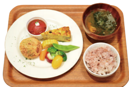
DELI 4品と 雑穀ごはん