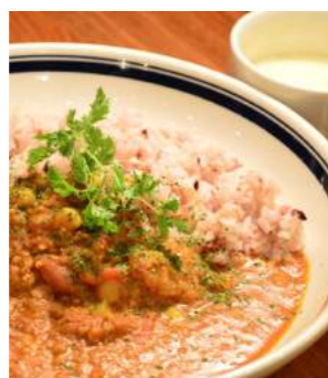
野菜ポタージュつき

手ごねハンバーグ (100g) つき + ¥300 手ごねハンバーグ & お好きなデリ 2品つき + ¥700