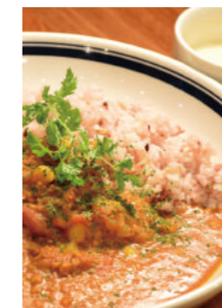
野菜ポタージュつき

土日祝日 限定 20食! 手ごねハンバーグ(100g)つき + ¥300 土日祝日 限定 20食! 手ごねハンバーグ & お好きなデリ2品つき + ¥700